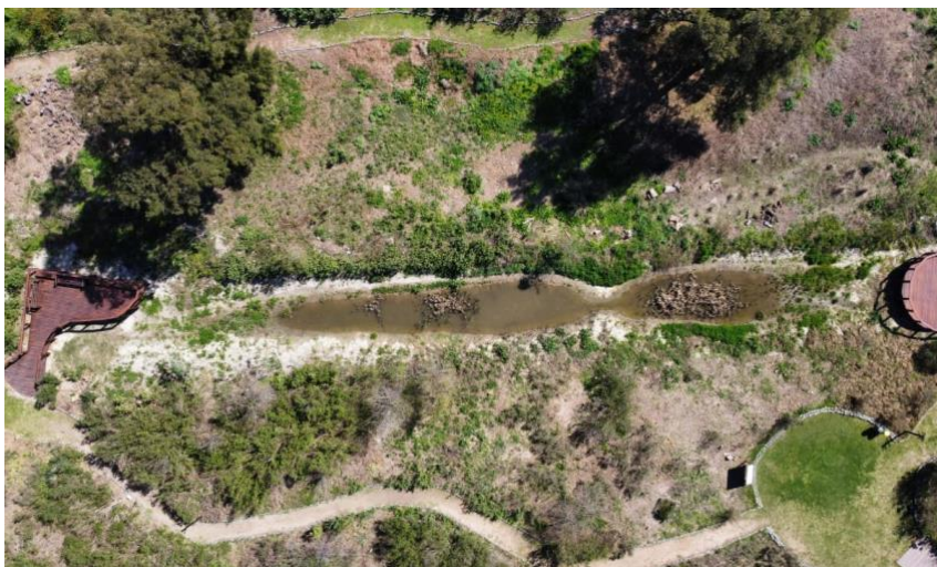
Figure 4: Piloto del Lago de Lugano.