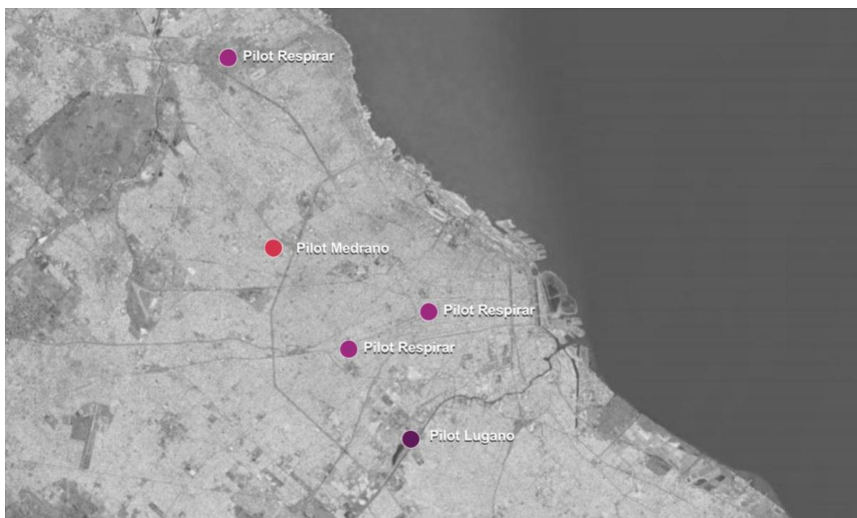
Figura 1: Proyectos piloto por colores, 2022.